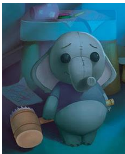
Pataud le héros éléphantique !