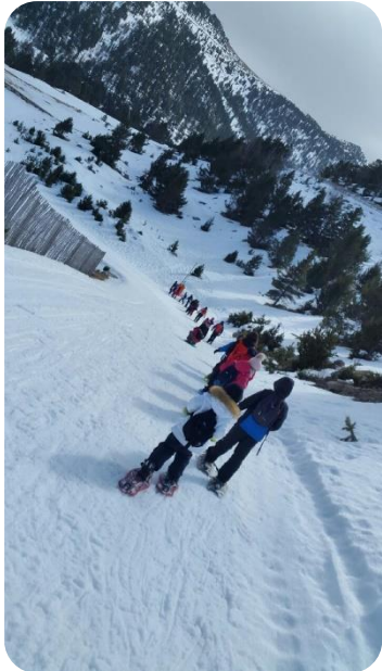
Balade en raquettes (Jour2)