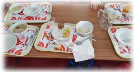
Le Repas midi (Jour2)