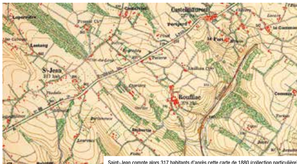
Saint-Jean compte alors 317 habitants d'après cette carte de 1880

Après la stagnation autour de 300 à 400 habitants, de 1866 à 1954, Saint-Jean dépasse les 500 habitants au début des années 1960 et franchit le cap des 10000 habitants en 2011.