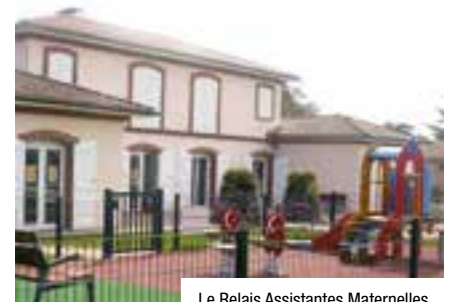
Le Relais Assistantes Maternelles

Parents, n'hésitez à consulter le journal « Ici le RAM » à disposition sur le site internet de la ville, à la Maison de l'Enfance et de la Famille et au Pôle Solidarité Petite Enfance. Les assistantes maternelles en sont les rédactrices en chef !