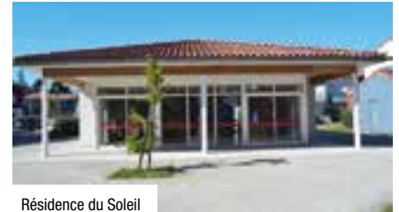
Résidence du Soleil

1 er samedi du mois de 10 h à 12 h : Atelier Cuisine en Famille (4 mars et 1 er avril)