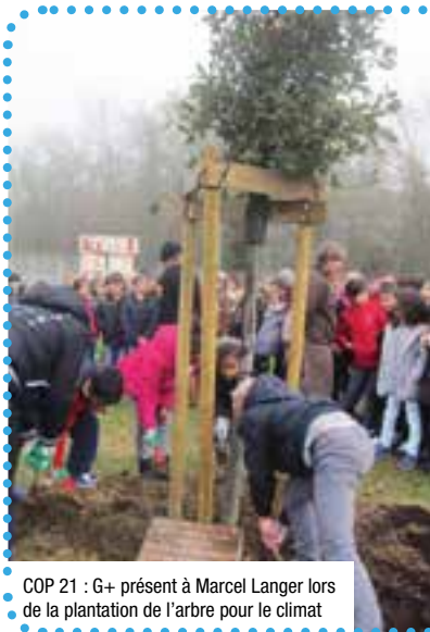
COP 21 : G+ présent à Marcel Langer lors de la plantation de l'arbre pour le climat

N'hésitez pas à venir nous rencontrer mais faites attention : l'enthousiasme et la bonne humeur sont contagieux à Capitole Agility !!!!!