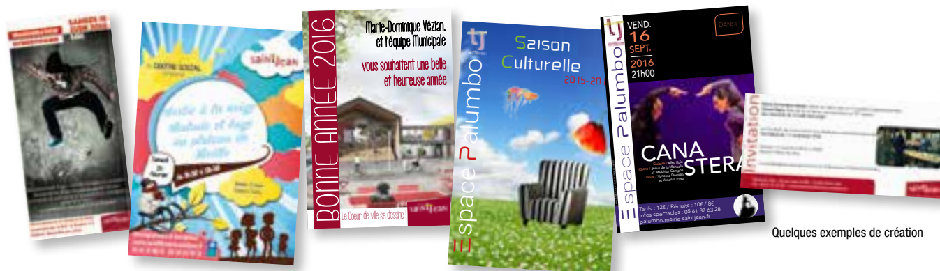
Quelques exemples de création